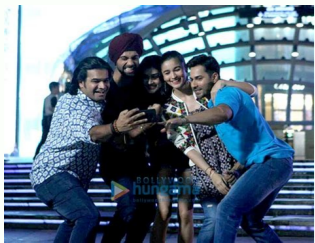
Hindi film badrinath.